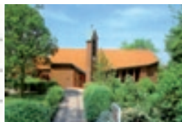
Christus Kirche Lachandorf