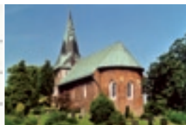
St. Walburgis Kirche Landsende